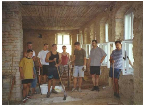
Feuerwehrkameraden beim Entkernen der alten Schule