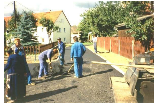
Ausbau des Dorfplatzes