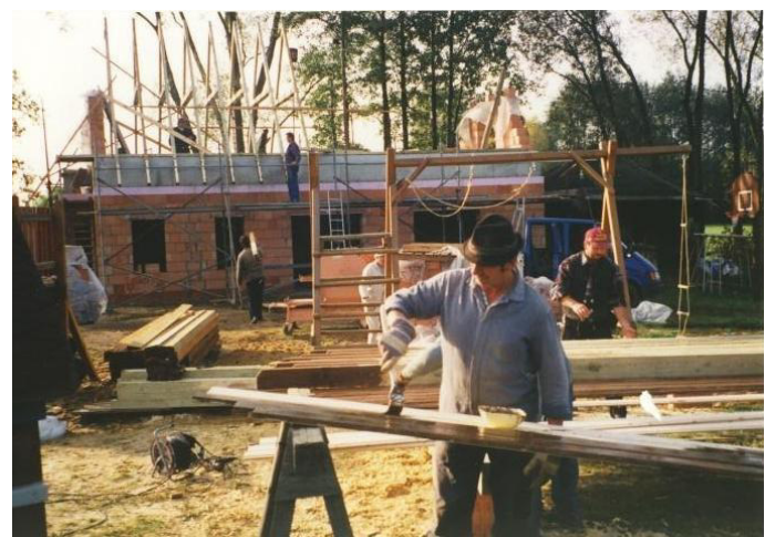
Bau des Kulturhauses durch die Einwohner des Ortes