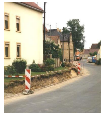
Ausbau der Hauptstraße

Weitere bauliche Tätigkeiten erfolgten im Bereich des Straßenbaus: So wurde die Ortsdurchfahrt der Kreisstraße K 9225 durch den Landkreis Bautzen grundhaft ausgebaut, daneben erfolgte an der Straße der Bau der Gehwege und einer neuen Straßenbeleuchtung. Auch zwischen Rabitz und Naußlitz wurde die Kreisstraße K 9225 durch den Landkreis Bautzen grundhaft ausgebaut.