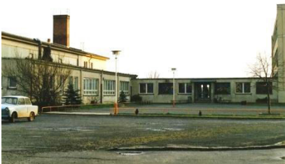
Schule vor der Sanierung

Obwohl sich die eigentliche Dorfansicht von Ralbitz kaum verändert hat, wurde doch enorm viel getan. So wurde der Parkplatz gegenüber der Kirche ausgebaut, der Schulweg und die Andrickistraße wurden grundhaft mit Straßenbeleuchtung und Entwässerung ausgebaut. Auch der Dorfplatz wurde komplett erneuert, erhielt eine Entwässerung und eine neue Straßenbeleuchtung (TG). Darüber hinaus erfolgte die Sanierung der Alten Schule mit dem Neubau des Feuerwehrgerätehauses. Bei den Entkernungsarbeiten in der neuen, als auch in der alten Schule wurden viele Leistungen von den Kameraden der Freiwilligen Feuerwehren und Vereinen ausgeführt. Durch den damaligen Träger, das Christlich Soziale Bildungswerk (CSB) Miltitz, wurde auch die Kindertagesstätte saniert und nach einem Trägerwechsel an den Sorbischen Schulverein e. V. durch die Gemeinde um einen Anbau erweitert.