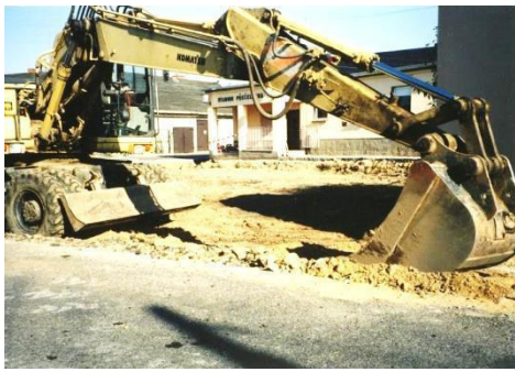
Sanierung des Vorplatzes am Stadion