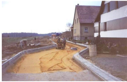
Ausbau der Andrickstraße