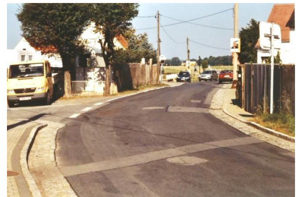
Sanierung der Hauptstraße