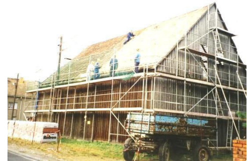
Sanierung der kommunalen Scheune

In Rabitz, ebenso wie in Cunnewitz und Schönau, wird durch die Teilnehmergeinschaft der Ländlichen Neuordnung Rabitz (TG) eine Flurneuordnung durchgeführt. Durch die TG wurden in diesen drei Orten auch viele Maßnahmen geplant und durchgeführt – gekennzeichnet durch TG. Die TG ist eine Einrichtung, die beim Landkreis Bautzen ansässig ist und durch Umlagen von den Grundstückseigentümern mitfinanziert wird. Ziel dieser Flurneuordnung ist es auch, die Vermessung und Flurneuordnung aller Flächen im Bereich dieser drei Orte durchzuführen.