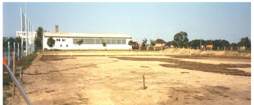
Neubau des Sportplatzes für die Schule