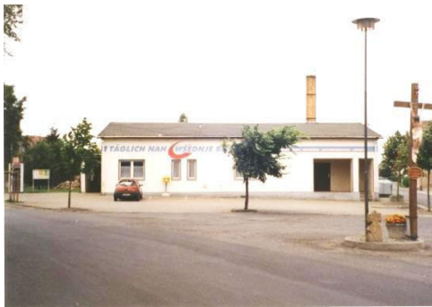
Parkplatz der Arztpraxis und der Kirche

Weitere bauliche Tätigkeiten erfolgten im Bereich des Straßenbaus: So wurde die Ortsdurchfahrt der Kreisstraße K 9225 durch den Landkreis Bautzen grundhaft ausgebaut, daneben erfolgte an der Straße der Bau der Gehwege und einer neuen Straßenbeleuchtung. Auch zwischen Rabitz und Naußlitz wurde die Kreisstraße K 9225 durch den Landkreis Bautzen grundhaft ausgebaut.