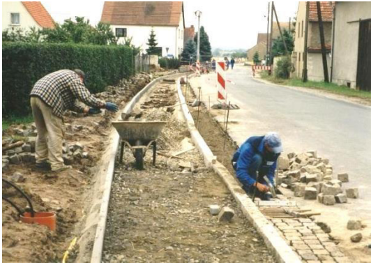
Bau des Gehweges an der Hauptstraße