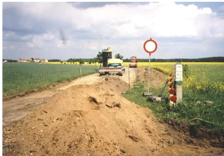
Ausbau der Staatsstraße S 101 in Richtung Doberschütz

Durch die Gemeinde erfolgten der Neubau des Gehweges, der Straßenbeleuchtung und der Straßenentwässerung an der Staatsstraße S 101. Den grundhaften Ausbau der Ortsdurchfahrt der Staatsstraße S 101 übernahm der Freistaat Sachsen.