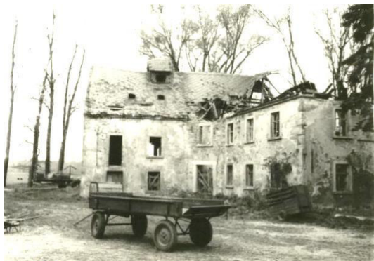
Jurasmühle in Naußlitz

Auch in Naußlitz wurde in den letzten Jahrzehnten viel bewegt. So wurde das Kulturhaus samt Jugendclub in Eigenleistung neu gebaut. Die Gemeinde erwarb die Grundstücke, sodass auch ein Sportplatz mit Spielplatz errichtet werden konnten. Ausgebaut wurden der Mühlweg und der Lindenweg. Auch der Dorfplatz wurde gestaltet und ausgebaut.