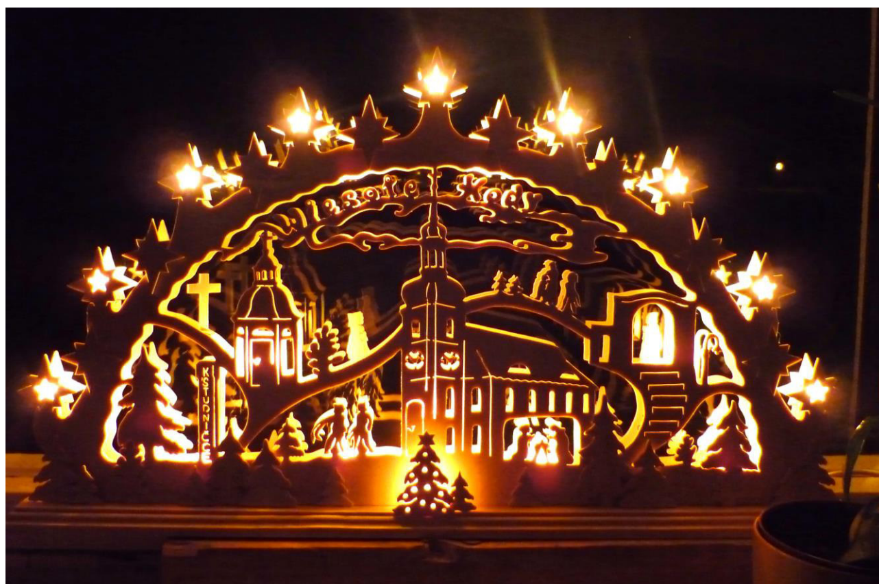
Schwibbogen mit der Rosenthaler Kirche als Motiv

www.ralbitz-rosenthal.de gemeinde@ralbitz-rosenthal.de