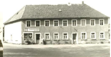
Der ehemalige Konsum in Ralbitz – heute Standort der Arztpraxis Jahny

Eine der „größten“ Investitionen waren die Sanierung der Turnhalle mit dem Neubau der Grundschule und die Sanierung des Gebäudes der Oberschule. Komplett saniert wurde das Gebäude der Oberschule und es wurden die Außenanlagen an der Schule und der Turnhalle gebaut und gestaltet. Hinsichtlich der Gebäude wurde darüber hinaus das Sportlerheim saniert.