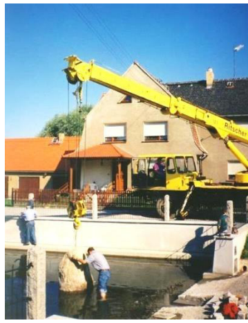
Bau des Wassermannes am Dorfteich