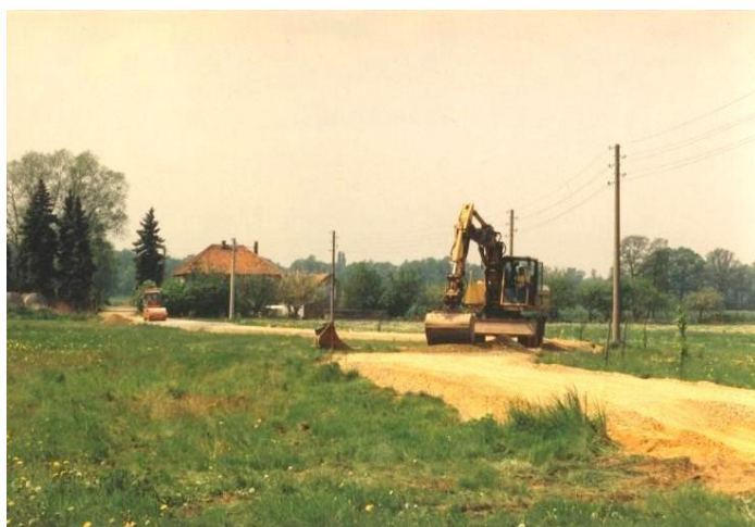
Ausbau des Mühlweges