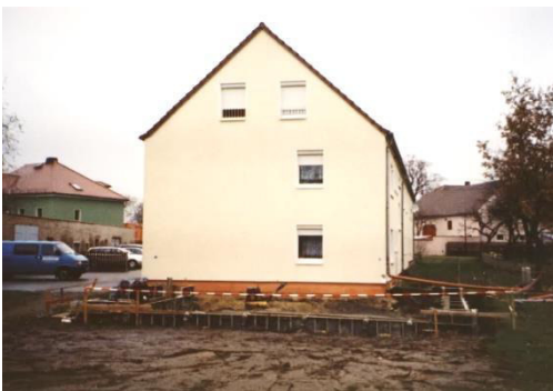
Ausbau des Kindergartens

In Rabitz, ebenso wie in Cunnewitz und Schönau, wird durch die Teilnehmergeinschaft der Ländlichen Neuordnung Rabitz (TG) eine Flurneuordnung durchgeführt. Durch die TG wurden in diesen drei Orten auch viele Maßnahmen geplant und durchgeführt – gekennzeichnet durch TG. Die TG ist eine Einrichtung, die beim Landkreis Bautzen ansässig ist und durch Umlagen von den Grundstückseigentümern mitfinanziert wird. Ziel dieser Flurneuordnung ist es auch, die Vermessung und Flurneuordnung aller Flächen im Bereich dieser drei Orte durchzuführen.