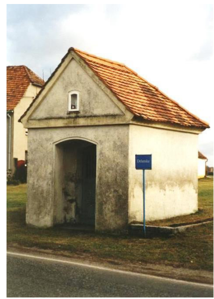
Die Kapelle vor der Sanierung

Durch die Gemeinde erfolgten der Neubau des Gehweges, der Straßenbeleuchtung und der Straßenentwässerung an der Staatsstraße S 101. Den grundhaften Ausbau der Ortsdurchfahrt der Staatsstraße S 101 übernahm der Freistaat Sachsen.